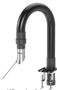
FAE083 Boquilla metálica circular

El cable y el adaptador son necesarios para poder conectar estaciones Compact con versión "E" y anteriores a FAE1.