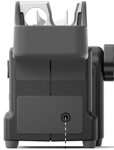
JTS 热风软管套装专用支架